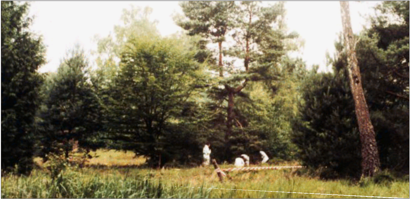
Fundort der Leichen im Jagen 138