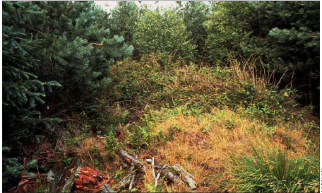
Fundort der Leichen im Jagd 147