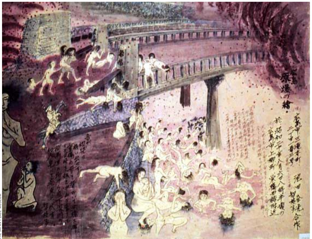
THE JAPAN PEACE MUSEUM

Wenn am Ende abgewendet wurde, was die ganze Welt in jenen Tagen bewegte, dann lag es entscheidend an der Entschlossenheit der Staatsführer Kennedy und Chruschtschow, auf keinen Fall in einen Krieg hineinzuschlittern. Auf amerikanischer Seite ist dies umfangreich dokumentiert: wie Kennedy von all den Handlungsoptionen, die seine Berater ihm vortrugen, stets diejenige auswählte, die am wenigsten provozierte; wie er auf getrennten Kanälen