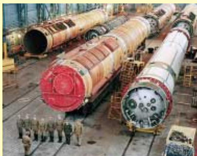
Demontage russischer Atomraketen bei Nowgorod

1998 Indien und Pakistan zünden atomare Sprengsätze