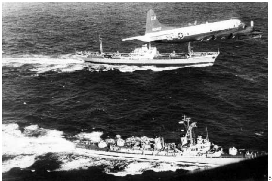
Sowjetischer Raketenrückzug*: Strategische Entscheidung

In der „klassischen“ Strategie waren zahlenmäßige Überlegenheit, Feldherrngeschick und Überraschung die Zutaten für militärischen Erfolg. Im atomaren Kräftemessen dagegen kommt es nicht darauf an, wer mehr hat, sondern wessen Waffen am besten gegen einen Überraschungsschlag des anderen geschützt sind.