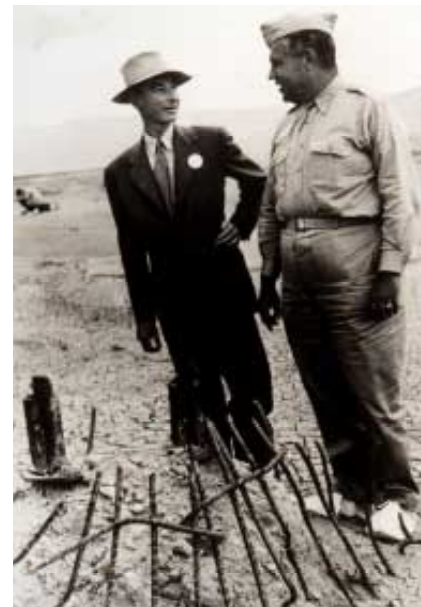
Atomplaner Oppenheimer, Groves (1945) Nukleare Jesuiten

Das Strategie-Studium versprach, was politischer Wissenschaft sonst abgeht – ein