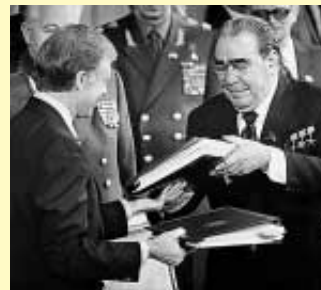
Carter und Breschnew nach Unterzeichnung des Salt-2-Vertrags 1979

1968 In Washington liegt der Atomwaffensperrvertrag zur Unterzeichnung aus. Er sieht eine Nichtweiterverbreitung von Nuklearwaffen vor, verpflichtet die Atommächte zur Abrüstung ihrer Bestände und verbietet den übrigen Mitgliedstaaten, Atomwaffen zu erwerben oder herzustellen. Der Vertrag wird 1995 unbegrenzt verlängert