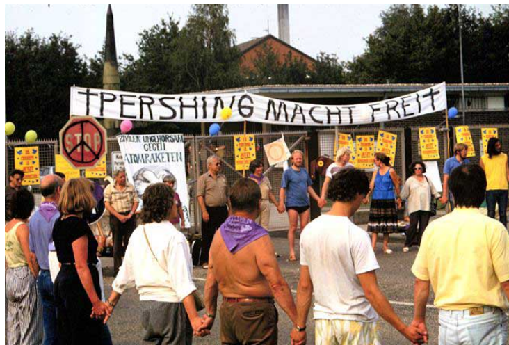
Nachrüstungsgegner in Mutlangen (1987): Schutt und Asche

„Aber dann wurde mir klar, daß wir diese Waffen unmöglich jemals einsetzen könnten.“ Danach konnte er wieder schlafen. Als Kennedy im Sommer 1961, wenige Monate nach der Übernahme der Präsidentschaft, ebenso gebrieft wurde, war er erschüttert: „Und wir nennen uns Menschen!“