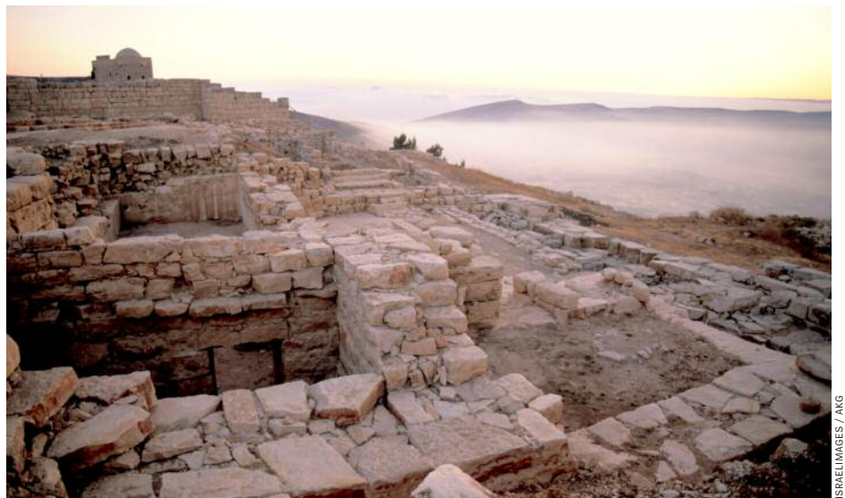
Ruinen des Jahwe-Tempels auf dem Garizim: 400 000 Knochenreste von Opfertieren

Was für eine Entdeckung. Unter den Israeliten brodelte ein Glaubenskrieg, die Nation war gespalten. Die Juden hatten mächtige Vettern, mit denen sie einen