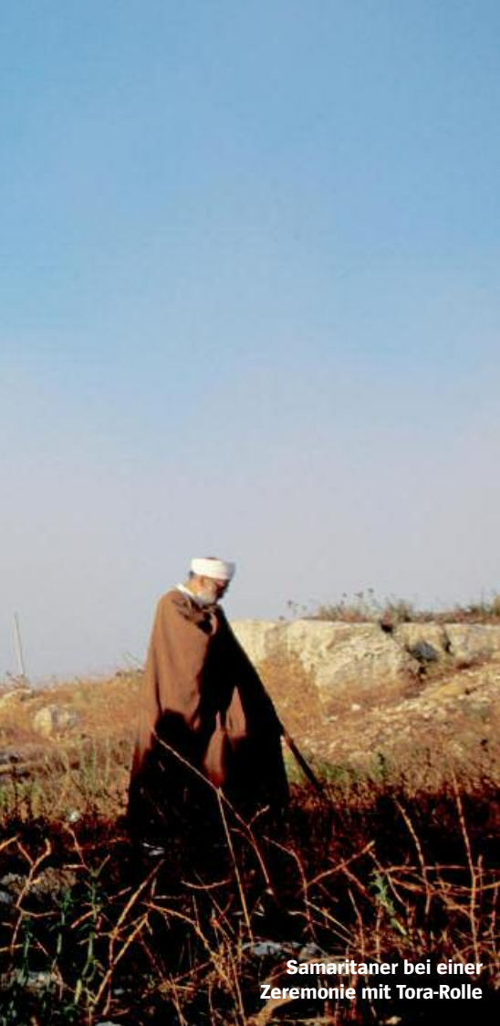
Samaritaner bei einer Zeremonie mit Tora-Rolle