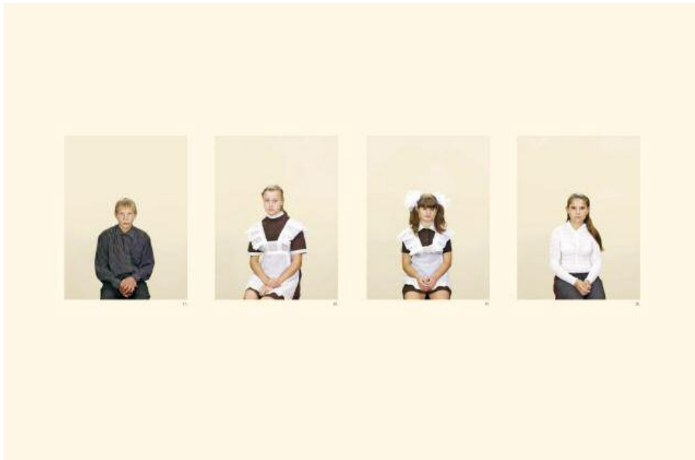
Simon-Fotos ukrainischer Waisenkinder: „Ich stelle mir manchmal vor, dass wir Geister sind“

Blut das ist, was uns am stärksten verbindet – dass Blut aber auch das ist, was uns am meisten Gefahr, Krieg und Grausamkeit beschert: Gezeigt werden Menschen, die miteinander verwandt sind. Es herrscht eine Leere um die vielen kleinen Bilder, die der Zuschauer füllen muss.