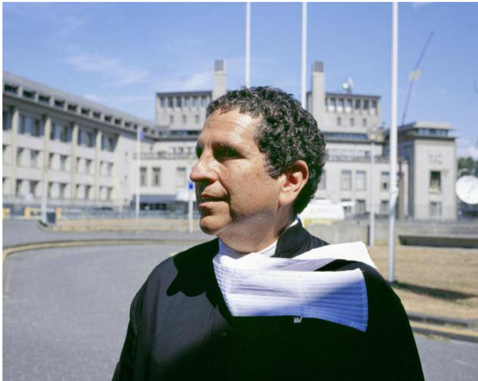
MYR MURAIET / DER SPIEGEL