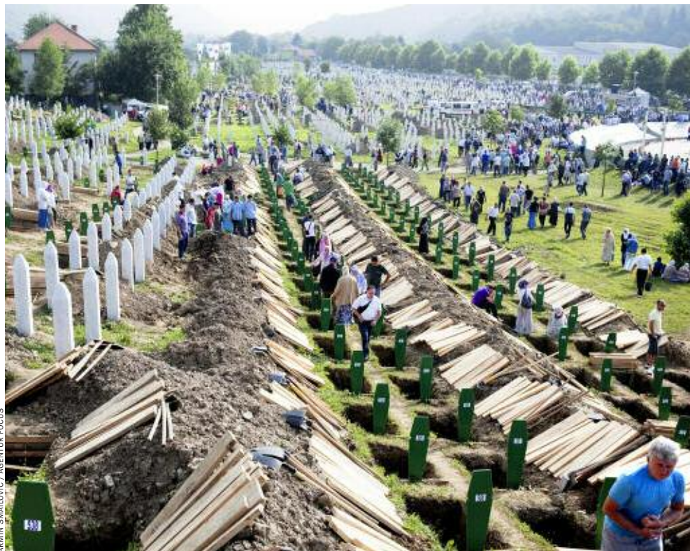
Gräber bei Srebrenica in Bosnien 2010: Suche nach Lücken in der Geschichtsschreibung