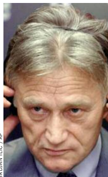
Momčilo Perišić war bis 1998 Generalstabschef der jugoslawischen Armee. Mit seiner Hilfe sollen Tausende Zivilisten verletzt oder getötet worden sein. Angeklagt wegen Mordes und Verbrechen gegen die Menschlichkeit.