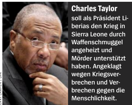
Charles Taylor soll als Präsident Liberias den Krieg in Sierra Leone durch Waffenschmuggel angeheizt und Mörder unterstützt haben. Angeklagt wegen Kriegsverbrechen und Verbrechen gegen die Menschlichkeit.

161 Anklagen hat es dort gegeben, 64 Verurteilungen, 13 Freisprüche. 35 Verfahren laufen noch. Eine Erfolgsgeschichte, das sagen die Zahlen, aber das Tribunal ist auch bekannt für sein Scheitern. Slobodan Milošević etwa, der wichtigste Angeklagte bis heute, wurde nie verurteilt. Sein Prozess endete 2006 mit seinem Tod. In wenigen Jahren muss das Tribunal seine Tore schließen, der Uno-Sicherheitsrat will