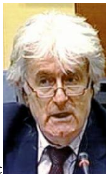
Radovan Karadžić war Präsident der Republika Srpska. Während des Bosnien-Kriegs mutmaßlich verantwortlich für das Massaker von Srebrenica. Angeklagt wegen Kriegsverbrechen und Verbrechen gegen die Menschlichkeit.