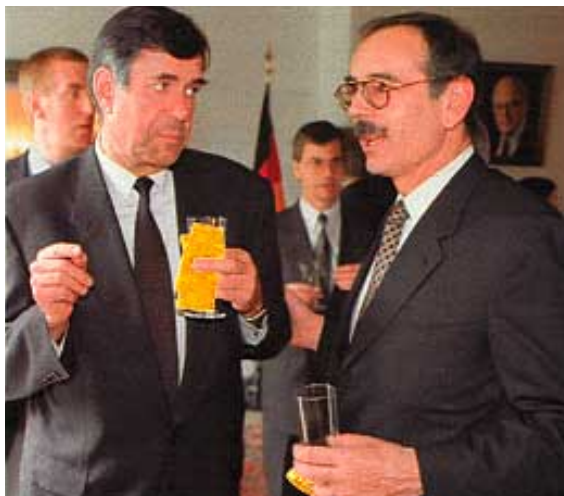
Foertsch, BND-Chef Geiger

ruhe und für die Intervention bei der Bundesanwaltschaft in Karlsruhe. Die Bundesanwälte ermitteln gegen Foertsch wegen des Verdachts der Spionage für den russischen Geheimdienst (SPIEGEL 14/1998). Das Verfahren steht kurz vor der Einstellung.