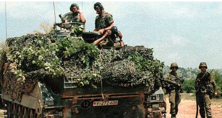
Bundeswehrpanzer M 113

Briten und Niederländer wurden zu der Bonner Vorauswahl bisher nicht konsultiert. Es gilt aber als sicher, daß sie sich weiter beteiligen werden. Frankreich dagegen wird als unsicherer Kantonist betrachtet: Die Franzosen entwickeln eine eigene Billigvariante für den Export in die Dritte Welt. Sie hatten sich deshalb zeitweilig aus dem multinationalen Projekt verabschiedet und so Verzögerungen verursacht.