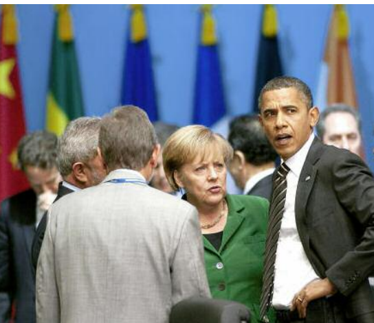
G-20-Regierungschefs in Seoul