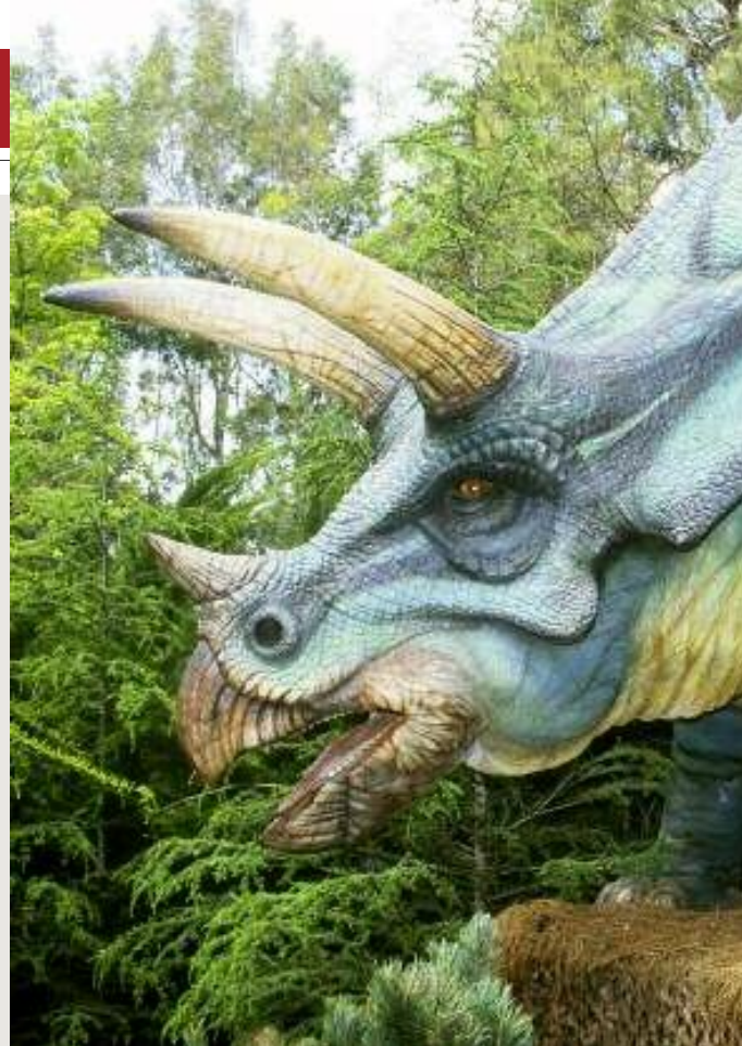
Wachstumsstadien des Triceratops-Kopfes (l.), erwachsener