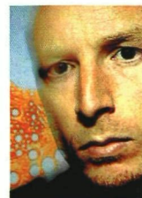
SOUND OF MUNICH: DJ HELL

DJ HELL. Sein Label nennt er „International Deejay Gigolos“, seine neueste Platte „Munich Machine“, und auch sonst kehrt der DJ aus München gern den bajuwarischen Techno-Stenz