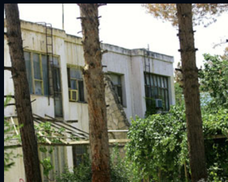
Obeidi-Haus in Masar-i-Scharif