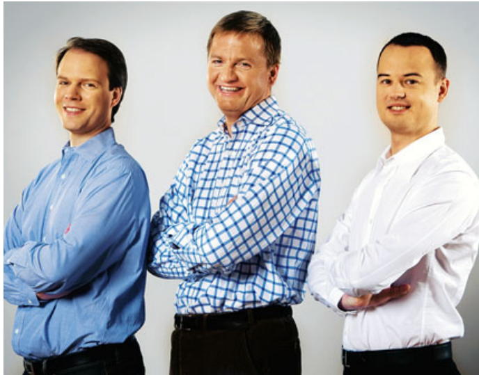
SchülerVZ-Management*: Marktführer bei den Communitys