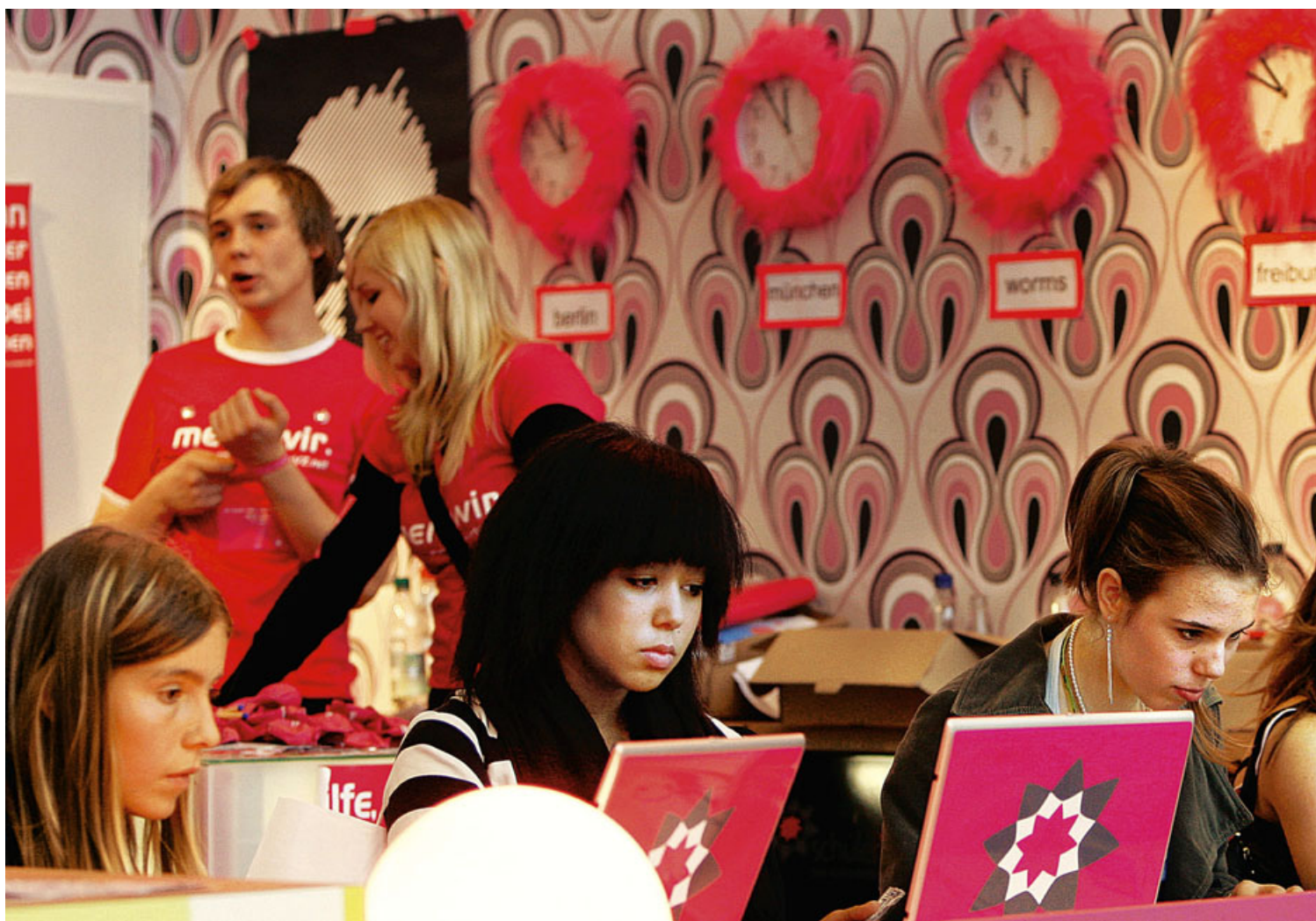
Jugendliche Internet-Nutzer (auf der Jugendmesse „You“ in Berlin, 2007): „heey nina mauzZ wollt dir einfach ma en paaar ganz liebe

Circa 3,5 Millionen Jugendliche ab 12 Jahren sind dort angemeldet, gut jeder dritte Schüler in Deutschland also. Damit zählt SchülerVZ in Deutschland zu den beliebtesten Internet-Seiten und zu den größten Online-Netzwerken. Beim großen Bruder StudiVZ, der Netz-Gemeinschaft für Studenten, sind sogar knapp sechs Millionen Nutzer registriert. Der Holtzbrinck-Verlag, dem beide Angebote gehören, ist damit deutscher Marktführer bei den Internet-Communitys.