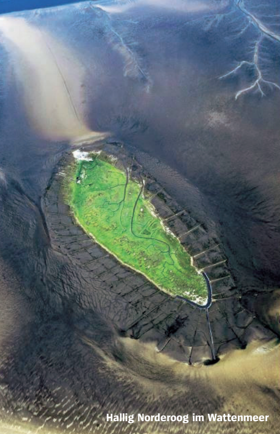
Hallig Norderoog im Wattenmeer