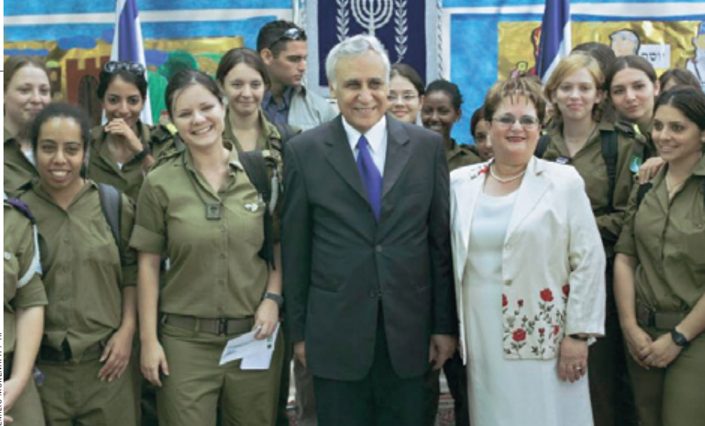
Präsident Katsav, Ehefrau Gila (am 9. Oktober in Jerusalem): „Wir beneiden ihn“

„Vertraulicher“ sei der Kontakt zwischen Russen und Israelis geworden, freute sich Putin zu Beginn des Treffens mit Olmert Mittwoch vergangener Woche im