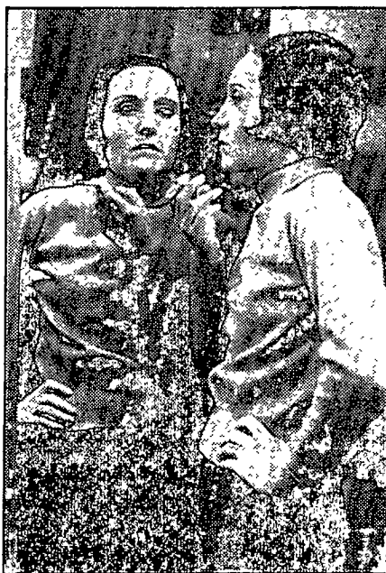
Jüdische Künstlerin Elisabeth Bergner, 1932 Theatergeschichte