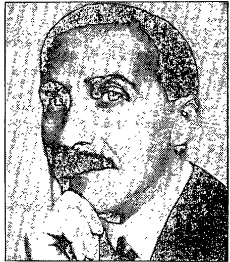
Jüdischer Journalist Wolff, jüdische Dichter Werfel, Stefan Zweig: Auflagenrekorde

schen Demokratischen Partei; Spartakus-Genossin Rosa Luxemburg konspirierte gegen den noch gar nicht bestehenden neuen Staat; Kurt Eisner war Vorkämpfer der bayrischen Räte-Republik.