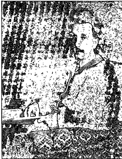
Jüdischer Physiker Einstein, 1927 Weltruhm

Politisch spielten deutsche Juden nur während der Revolutions-Wirren 1918/19 eine größere Rolle: In Berlin arbeitete Professor Hugo Preuß an der neuen Reichsverfassung; Chefredakteur Theodor Wolff war Mitbegründer der Deut-