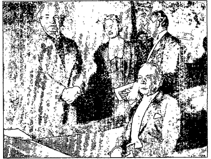
Jüdischer Politiker Rathenau (linkes Bild, l), 1921, jüdischer Intendant Reinhardt (rechtes Bild, r), 1932*: Vor dem Martyrium...

dem zugleich Sauerstoff freigesetzt wird. Für Sowjets wie Amerikaner erlangte dieses Forschungsgebiet besondere Bedeutung, seit für die Raumfahrt künstliche Sauerstoffquellen gesucht werden.