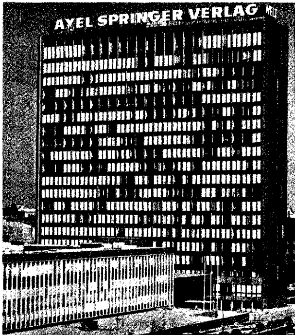
Springer-Haus in Berlin: Vor dem Druckhaus Widerstand ...

DUTSCHKE: In der Vergeudungsgesellschaft, würde ich sagen. Denn die für profit- und herrschaftsorientierte Gesellschaftsordnungen typischen Konsumtionsexzesse — Kriege sowie die ungeheuren toten Kosten; Rüstung, unnütze Verwaltung und