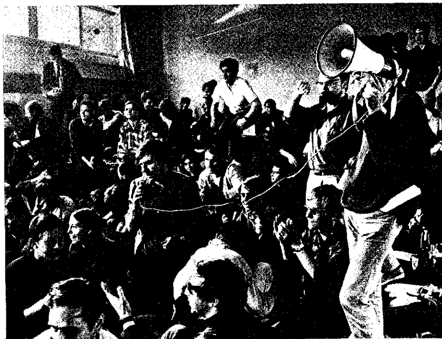
... gegen die Herrschaft von Menschen: Studentenfürer Dutschke (M.), Studenten

DUTSCHKE: Ja, da gibt es zwei Konzeptionen. Die eine Form der Gegen-Universität ist begriffen als Appendix, als Anhängsel der bestehenden Universität. Das heißt: Wir versuchen, im nächsten Semester Vorlesungskurse zu initiieren von Doktoranden, von Studenten mit guter Ausbildung, von Assistenten und Professoren. Inhalt des Programms sind Diskussionen, Referate und Seminare über Themen, die bisher innerhalb der Universität nicht diskutiert wurden.