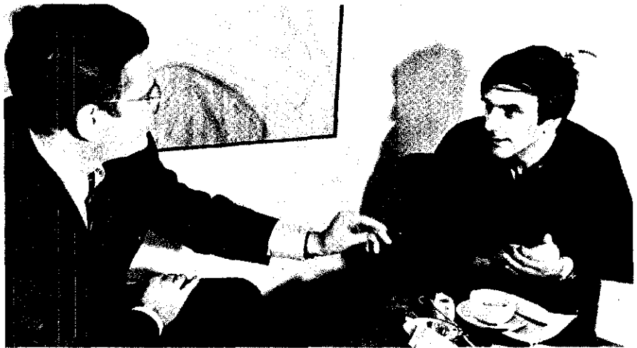
Dutschke (r.) beim SPiegel-Gespräch in der Hamburger SPiegel-Redaktion*

Dutschke: Die Studentenschaft war in der Geschichte der Bundes-