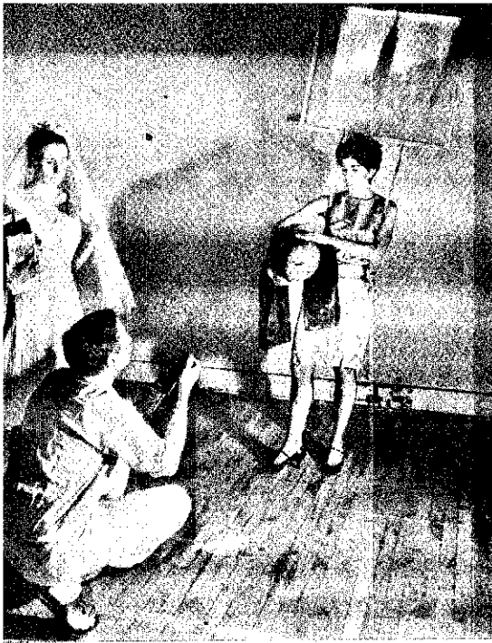
Mixed-Media-Show von Rauschenberg Steigerung der Sinne