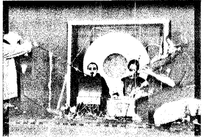
Mixed-Media-Oper von Schönbach, Mixed-Media-Konzert von Young: Erweiterung des Bewußtseins