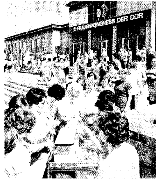
DDR-„Frauenkongreß“ 1969 „Herz und Tat für unseren Staat“

So sind rund zwei Drittel der im Handel wie im Post- und Fernmeldewesen Beschäftigten, fast jeder zweite LPG-Bauer, 41 Prozent der Arbeiter und Angestellten in der Industrie sowie zwölf Prozent der im Baugewerbe Tätigen Frauen. 80 Prozent der Lehrlinge in der Datenverarbeitung, 60 Prozent in der chemischen Industrie und fast 50 Prozent der angehenden