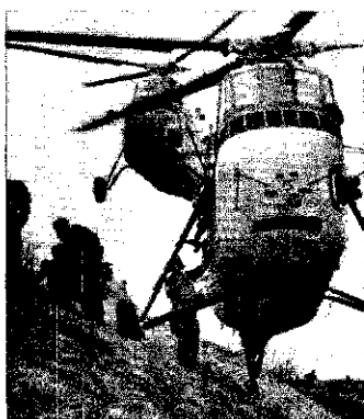
Luftlandtruppen der Bundeswehr

Der Massenabsprung von Fallschirmjägern ist so überholt wie die Kavallerie-Attacke: Die Fallschirmsoldaten müßten im Ernstfall mit ihrer Vernichtung rechnen. Generalstäbler der Bundeswehr entwickeln deshalb Pläne für eine neue Kampfesweise. Luftsturmtruppen sollen – wie bei der US-Army und bei der Roten Armee – von Hubschraubern aus kämpfen. Die Dornier-Werke arbeiten an einem raketenbestückten Kampfhubschrauber, der so schnell fliegen soll wie einst die Me 109.