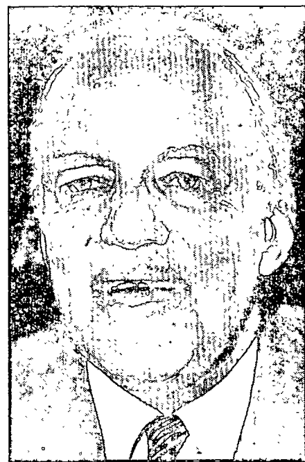
Geheimdienstler Allen Dulles SS-General nach Zürich beordert

Die Verhandlungen zogen sich indes in die Länge. Kaltenbrunner, Nachfolger Heydrichs als SD-Chef, der ähnliche Pläne verfolgte und von Wolffs Aktion erfuhr, intervenierte bei Himmler.