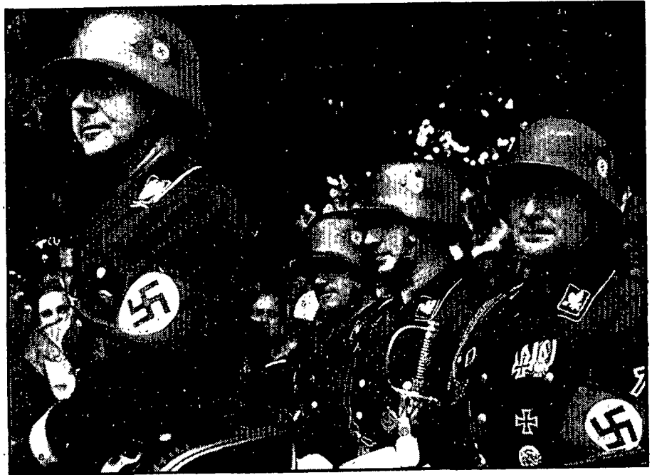
Himmler-Adjutant Wolff (r.), Chef (l.): Beim Massaker von Minsk...

Der Pelz des SS-Wolff schillert vielmehr derart, daß seine wirkliche Farbe und mehr noch seine Qualität schwerer zu ermitteln ist als bei den meisten Oberen des schwarzen NS-Ordens.