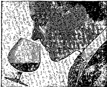
das Bouquet beweist: