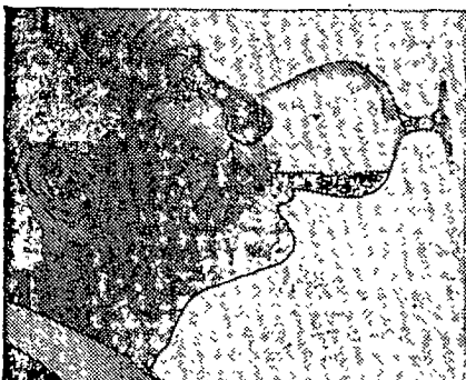
ein runder Genuß!