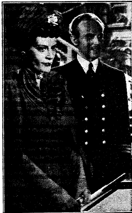
Zeit, sich zu verlieben Sybille Schmitz, Hans Nielsen