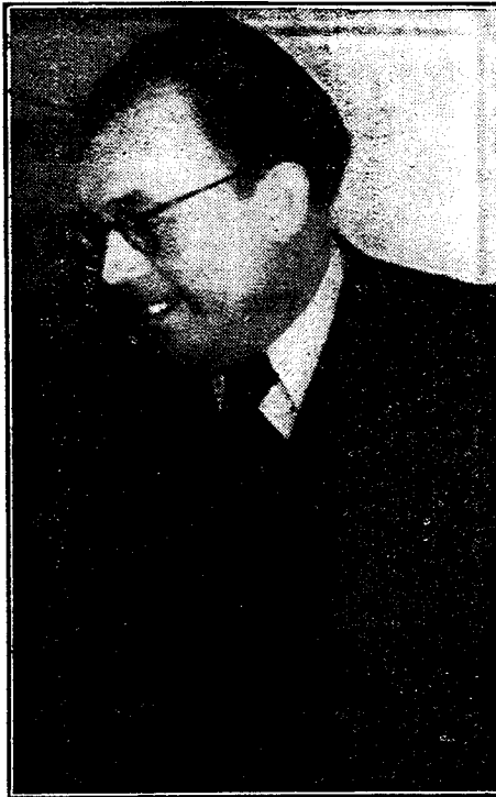
Erst verboten, dann groß geschrieben Herbert Selpin