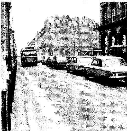
Exklusiv-Spur in Paris Bei Provinzlern großzügig

Allerdings — einen Nachteil haben die Korridore: Weil mehr als 60 Prozent aller Pariser Straßen Einbahnstraßen sind, richtete die RATP sie auch in Gegenrichtung von Einbahnstraßen ein. Mehrere Passanten wurden getötet, weil sie gewohnt waren,