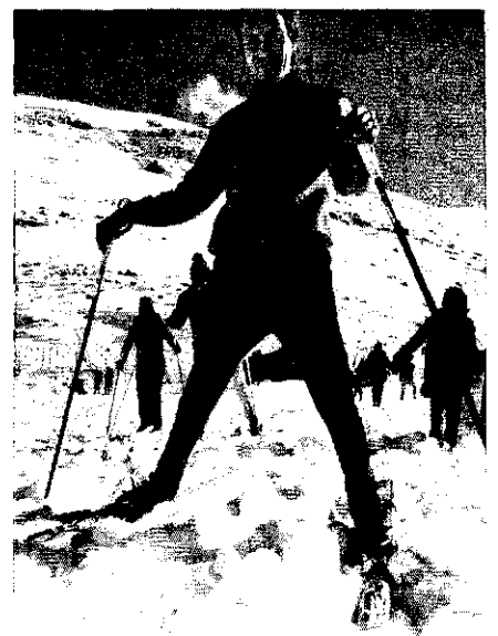
Skifahrer in Israel 2000 Jahre ohne Pisten

Lange verteidigten die Militärs den Höhenzug des Hermon, dessen Pisten in Gewehrschußweite der Syrer liegen. Routinemäßig sperrten sie an Wochenenden die schmale Gebirgsstraße,