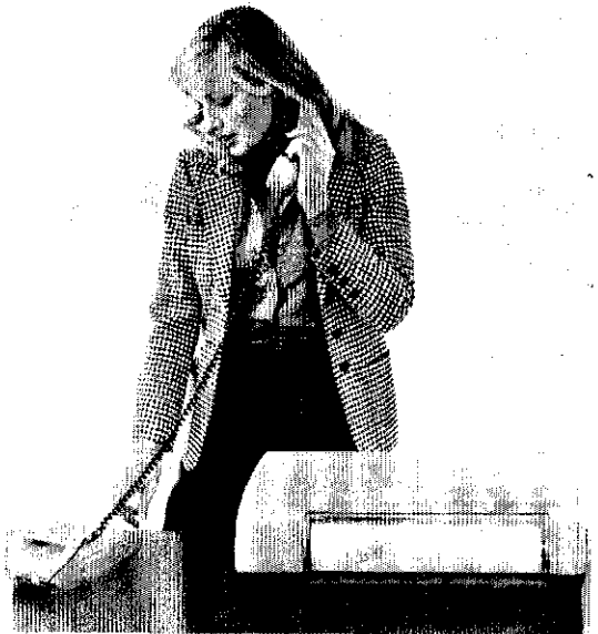
Olympia-Fernkopierer Dabei geht es ums große Geld