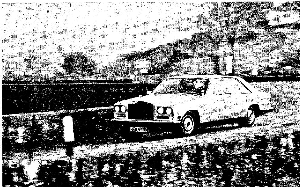
Neuer Rolls-Royce Camargue: Zwei Wärmefühler für die Füße

Sechs Monate währt die Bauzeit eines Camargue, weil der aus über 80 000 Einzelteilen bestehende Wagen (Durchschnittsauto: etwa die Hälfte) schon vor der Reise zum Kunden viel unterwegs sein muß. Seine Schale entsteht bei der Spezial-Firma Mulliner Park Ward in London. Sie wird bei