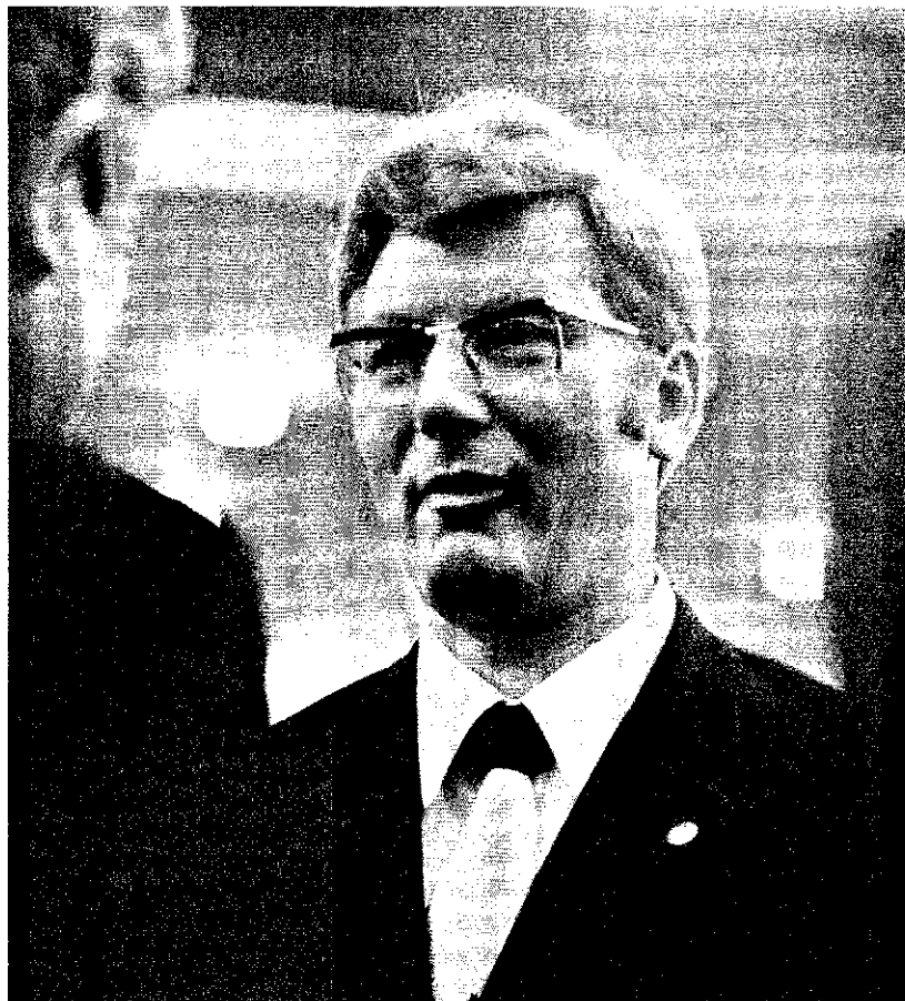
SED-Chefpropagandist Lamberz: Generalsekretär in Wartestellung