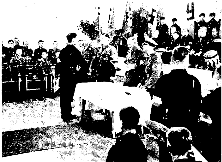
Adolf-Hitler-Schule Sonthofen*: „Wir tragen stolz des Führers Namen“

„Die Dialektik seiner Aufgabe“, so meditierte unlängst ein Ost-Berliner Parteiveteran über die weiteren Karriere-Chancen des Honecker-Vertrauten. „zwingt ihn zum Alles oder Nichts.“ Da die Parteipropaganda unablässig „Erwünschtes für bereits Erreichtes“ ausbebe und sich kaum einer bemühe, diese Kluft zwischen Anspruch und Wirklichkeit aufzuheben, müsse Lam-