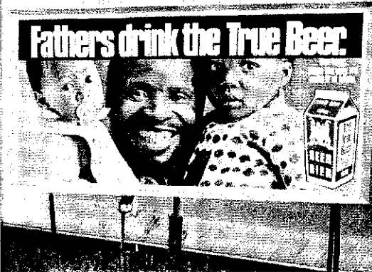
Bier-Werbung in Südafrika Bei König und Tantchen

Methyläther oder Benzindämpfe, viele Jugendliche rauchen pulverisierten Schuhleim.