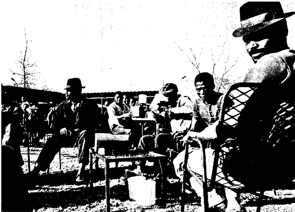
Afrikaner beim Biertrinken: Brandy statt Brot

Doch das von den Weißen angebotene Bantu-Bier lehnen viele Schwarze neuerdings ab, schon wegen seines Namens. Sie wollen sich die harten Drinks des weißen Mannes gönnen. Die gibt's für Afrikaner in Tausenden illegaler Kneipen, den sogenannten Shebeens in den schwarzen Wohngebieten südafrikanischer Städte.