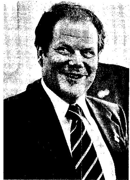
DKP-Chef Mies Werben um Gastarbeiter

Vor allem in Industrieregionen haben die Exilgruppen einigen Einfluß. In Ludwigshafen etwa ist die PCI mit knapp 50 Mitgliedern ebenso stark wie die DKP. In Wolfsburg, wo 7000 VW-Italiener leben, bekam die PCI letztes Jahr bei einer Testwahl rund 60 Prozent der Stimmen. In parteinahen Hilfsorganisationen mit Namen wie „Verband der Gastarbeiter und ihrer Familien“ sind mehr als 20 000 Ausländer organisiert.