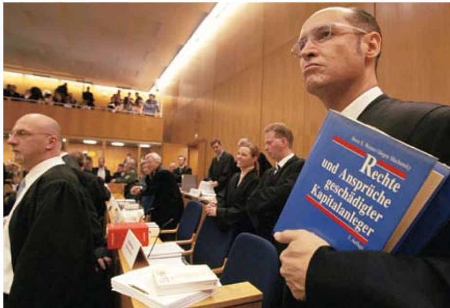
Telekom-Prozess in Frankfurt am Main: Neue Gesetze gegen die Klageflut

Die Blockade weniger Kleinanleger bei KarstadtQuelle ist kein Einzelfall. Den meisten Opponenten geht es um Transparenz. Doch auch Geld spielt neuerdings eine große Rolle.