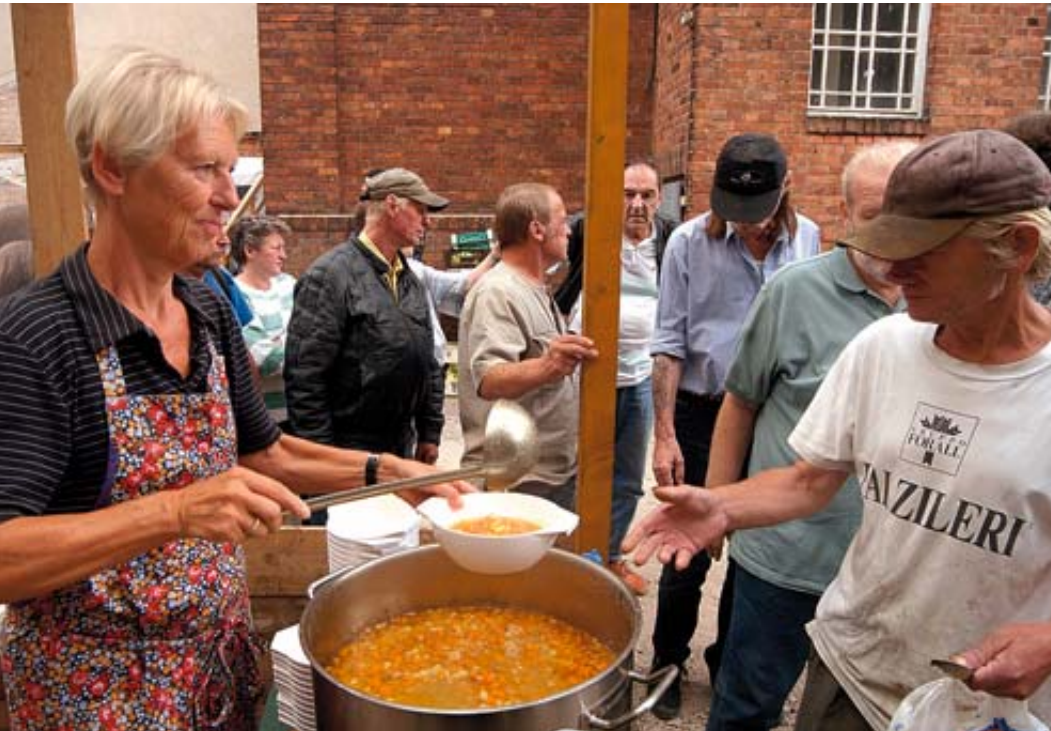
Arme (Essensausgabe an Obdachlose in Berlin): Chancen ungleich verteilt