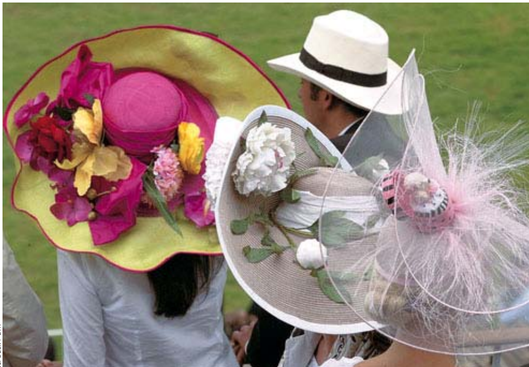
Reiche (an der Galopprennbahn Iffezheim): Zins und Zinseszins mehren die Vermögen

Einklang mit der Definition der EU liegt diese Grenze bei 60 Prozent des mittleren Einkommens aller vergleichbaren Haushalte. Für eine vierköpfige Familie sind dies – einschließlich aller staatlichen Zuschüsse – etwa 1550 Euro im Monat.