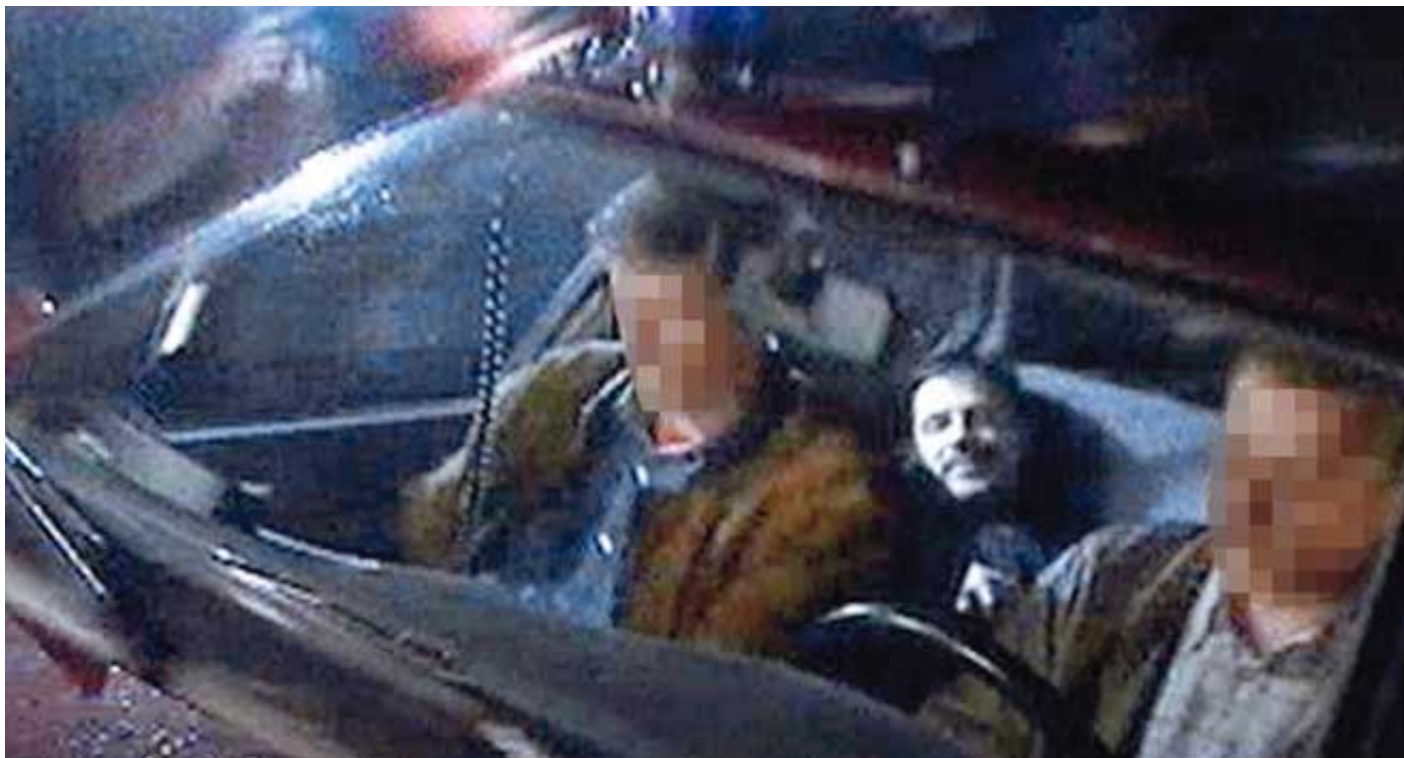
Entfloherer Dutroux bei seiner Festnahme (M.), Polizeibeamte (1998): Wie ein kleines Kind

Welt abschieben, aus der keine Schreie herüberdringen.