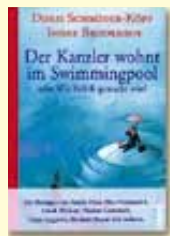
Mandate, Diäten, Hammelsprung – Prominente erklären, wie Politik gemacht wird

„1979“ ist ein Roman über Dekadenz – die Dekadenz westlichen Konsums und östlicher Heilslehren, die Dekadenz der Lager und die Dekadenz der Drogenpartys, „und plötzlich, auf einmal, sah ich auch mich in meiner ganzen widerlichen Erbärmlichkeit“. ♦