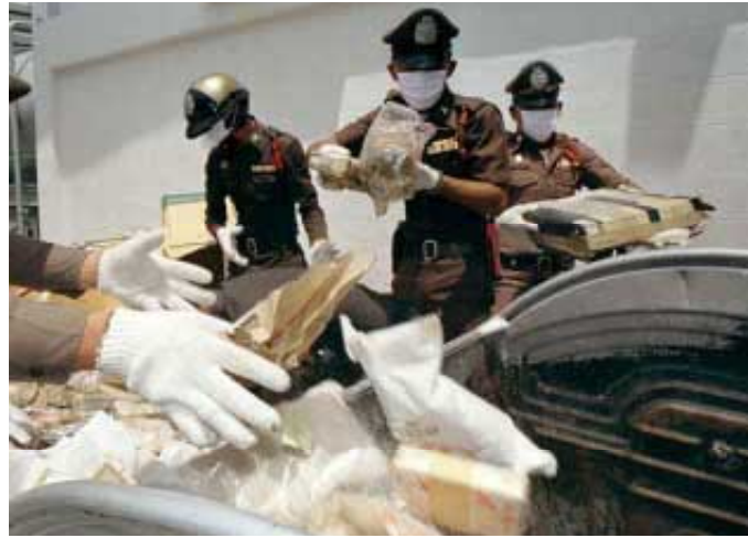
Heroin-Vernichtung (in Thailand): Eher Medikament als Droge?

Erfolgreich war der Stoff auch deshalb, weil zumindest Bayer am Markt mit der bis heute branchentypischen Brutalität voringing. Carl Duisberg, damals Bayer-Prokurist und noch heute prominent vertreten in der Gedächtnisgalerie der Deutschen, verlangte von seinen Untergebenen, sie sollten ihre Gegner „mundtot schlagen“, wenn diese behaupteten, Heroin sei nicht sicher. Eine kleine Zahl unbeugsamer Mediziner