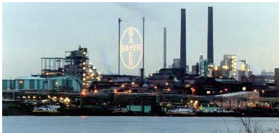
Bayer-Zentrale in Leverkusen: Wussten die Manager, was die Substanz anrichten kann?