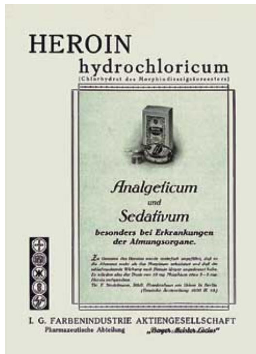
Heroin-Werbung: Mit Getöse auf den Markt

Schneller zur Sache ging es in den USA, dem besten Kunden von Bayer. Die Amerikaner lebten damals ohnehin in einer Art Junkie-Staat. Zehn Prozent aller Ärzte galten als opiatabhängig, mehrere hunderttausend Menschen spritzten sich Morphin, zahllose eingewanderte Chinesen waren