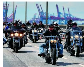
Harley-Biker in Hamburg

SPIEGEL: Vor knapp 50 Jahren soll der Film „Easy Rider“ die Firma Harley-Davidson vor dem Ruin gerettet haben. Die Marke stand für ein alternatives Lebensgefühl.