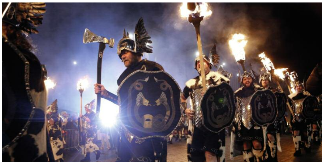
Wikinger-Folklorefest in Schottland

Paare in Deutschland sind ungewollt kinderlos, jedes zehnte Paar weiß nicht, weshalb. Forscher am Leibniz-Institut in Jena haben eine mögliche Erklärung: Bei einer von acht betroffenen Frauen fanden sie ein verändertes Wt1-Gen. Bisher nahm man an, dass das Gen nur eine Rolle bei der Organentwicklung spielt. An Mäusen zeigte sich aber, dass Wt1 auch für die Einnistung des Embryos wichtig ist.