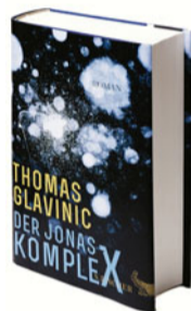
Thomas Glavinic: Der Jonas-Komplex. S. Fischer; 752 Seiten; 24,99 Euro. Erscheint am 10. März.

Glavinic nimmt sich so viel Raum wie noch nie, 752 Seiten. Ist das nicht im Gegenteil etwas größtenwahnsinnig? Vielleicht, aber schon auf den ersten zwei Seiten landet er mehr Lacher als andere in zwei Romanen. Der Jonas-Komplex hat einen lässigen Sound, ein Dicke-Eier-Roman, der nie unsympathisch wird, weil Glavinic jederzeit die Bereitschaft zur Selbstdemontage hat. So schnell hüpfert er zwischen den Geschichten hin und her, dass sich der Leser von Seite zu Seite neu orientieren muss. Die Häppchen-Dramaturgie macht das Buch genauso rast- und ruhelos wie die Protagonisten. Ein Spiel mit der Wahrnehmung. So ungekünstelt es daher kommt, so kunstvoll ist es.