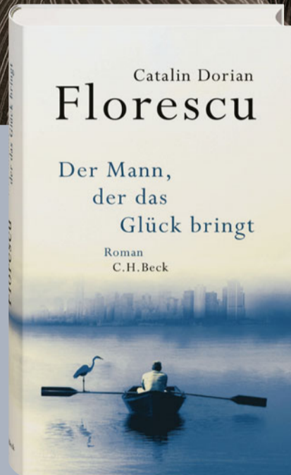
327 S. Geb. € 19,95 ISBN 978-3-406-69112-6