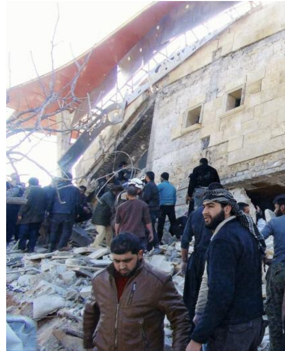
Zerstörtes Krankenhaus in Nordsyrien: Für Putin ist

Berlin kommt dabei eine Schlüsselrolle zu. Die deutsche Regierung hat zwar Putins Vorgehen auf der Krim und in der