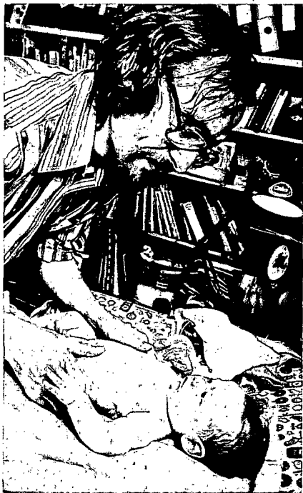
Vater bei der Säuglingspflege Enge Beziehung schon zum Kleinkind

FTHENAKIS: Die wurde, meine ich, recht unreflektiert aus psychoanalytischen Überlegungen übernommen; sie beruht auf Voreingenommenheit