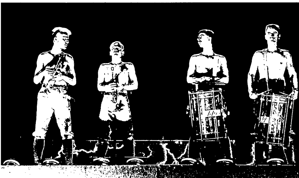
Popband „Laibach“: „Wille zur Macht, Tod und Schicksal“

Als „Docutainment“ – hier eine Prise Dokumentarfilm, da ein Häppchen Show – kündigt Mitarbeiter des französischen Meeresforschungsinstituts Ifremer und ihre Finanziere das TV-