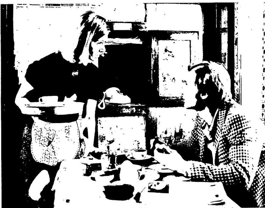
Handke-Verfilmung „Die Angst des Tormanns“*: „Oft zu überschwenglich“

WENDERS: Den mache ich ja. Das wird mein nächster Film sein. Der heißt „Bis ans Ende der Welt“. Darin gibt es eine Szene, die in Australien spielt, wo ein Volk lebt, das schon am Boden liegt, vollkommen am Ende, niedergemacht. Ich meine die Aborigines. Die wohnen in Hütten, kochen am offenen Feuer. Diese Hütten sind völlig leer. Nur irgendwo hinten brummt ein Generator, und das