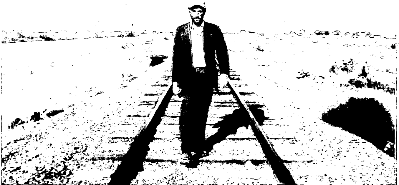
Wenders-Film „Paris, Texas“: „Im Sündenbabel der Neuzeit gefilmt“

muß sein wie eine Autofahrt durch die Sahara.