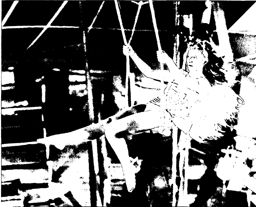
Wenders-Film „Der Himmel über Berlin“: „Die Geliebte als Belastung“

WENDERS: Ich bin nicht dieser Engel. Aber es stimmt, es ist meine erste, wirklich schöne Liebesgeschichte. Am Schluß meines vorletzten Films, „Paris, Texas“, umarmt ein noch sehr kleiner Mann seine Mutter. Der Vater gibt die Bühne frei für diese andere Liebe. In „Der Himmel über Berlin“ wollte ich weitergehen. Ich wollte etwas als möglich zeigen, statt darauf zu bestehen, daß