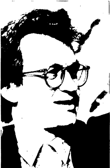
Filmemacher Wenders „Mit der Phantasie von Kindern“

nichts möglich ist. Das Kino muß wieder versuchen, den Menschen dienlich zu sein. Das Kino könnte der Engel sein.