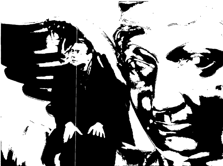
Wenders-Film „Der Himmel über Berlin“, Darsteller Ganz: Grauenvolle Ewigkeit

WENDERS: Weil es das Schwerste ist und weil es auch vom moralischen Standpunkt nichts Schöneres gibt, als jemand zum Lachen zu bringen. Auch diesmal sollte es ja eine Komödie werden. Aber es wurde ein großes Scheitern.