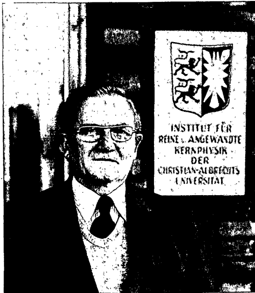
Atombomben-Forscher Bagge Arglos vor dem Karren?

gan Administration“ (Preis: 2000 Mark) auf den Markt, das laut Eigenwerbung „die aktuellste Zusammenfassung des amerikanischen Policy making“ darstellt, mit „wertvollen Informationen für jeden, der politische oder wirtschaftliche Beziehungen zu den Vereinigten Staaten unterhält“.