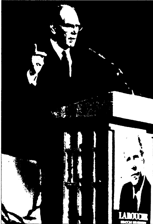
Rechtsradikaler LaRouche: Pakt mit dem Ku-Klux-Klan

Dem Kölner Bundesamt für Verfassungsschutz (BfV) erscheint die EAP,