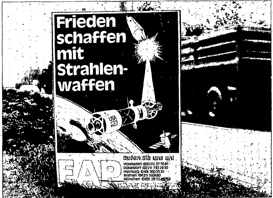
EAP-Rüstungswerbung: H-Bomben-Selbstbau dementiert