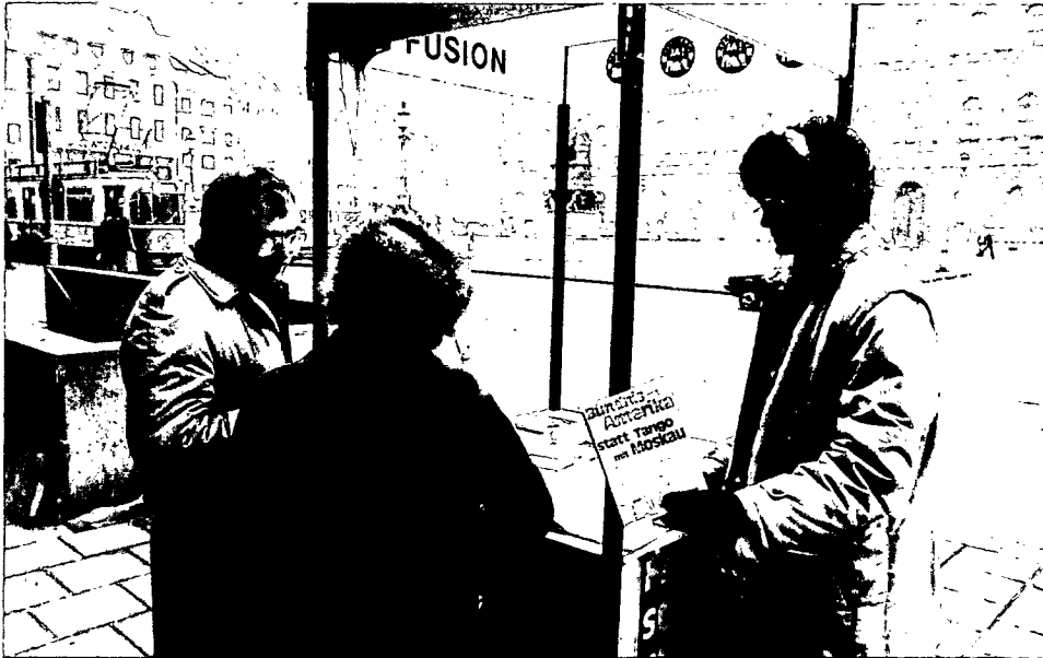
EAP-Informationsstand* : Kampf gegen die „Hexe von Windsor“