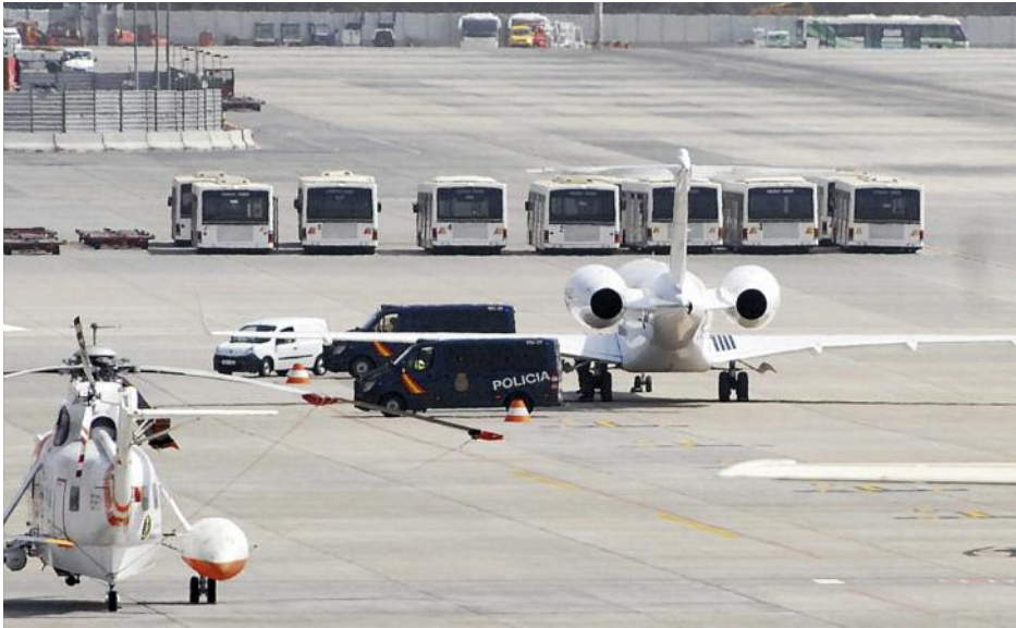
Festgesetzter Jet auf Gran Canaria: Die Crew landet in Einzelzellen

sie um, lautet die Botschaft. Lückert schaut aus dem Fenster nach hinten: Unter den Flügeln stehen Militärs mit Maschinengewehren. Nur die dünne Metallhaut des Flugzeugs trennt sie von 20000 Litern Kerosin. „Es ist zum Fliegen gebaut, nicht als Panzer“, flüstert Lückert seinem Kopiloten zu.