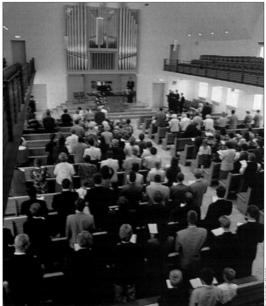
Neuapostolischer Gottesdienst (in Leipzig): Angst ums Seelenheil

Jede der 3000 deutschen Gemeinden zählt meist nicht mehr als 250 Mitglieder. Ihr Innenleben schirmt die Großsekte sorgfältig ab. Die NAK gilt in der Öffentlichkeit als harmlose Freikirche,