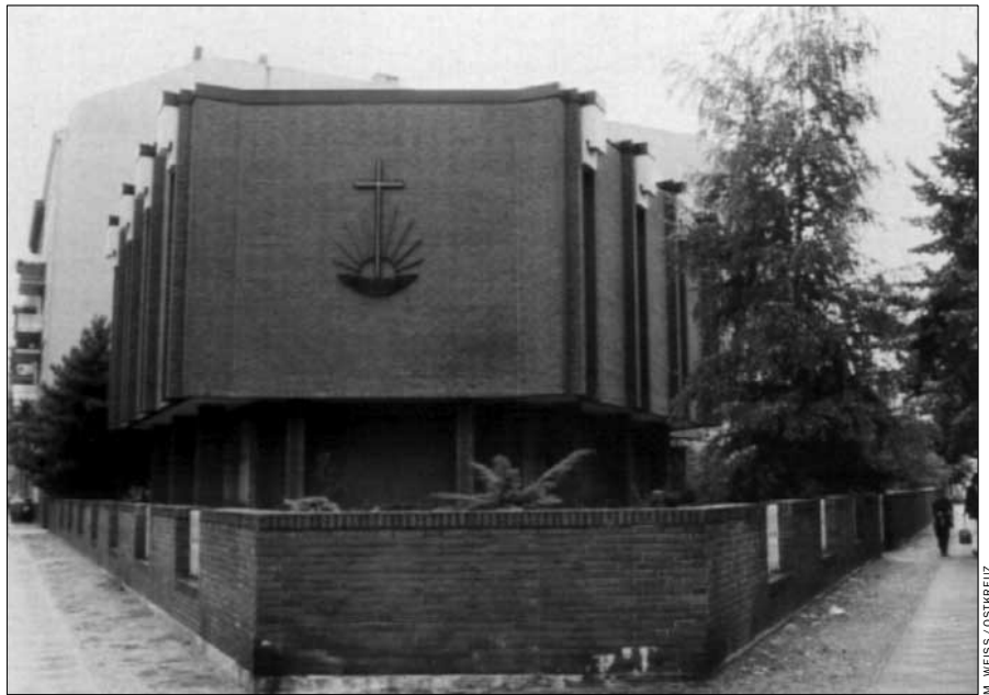
Neupostolische Kirche (in Berlin-Moabit): Warten auf die Wiederkehr Jesu

halten. Das hinderte den Stammapostel Bischoff nicht, Anno 1933 Adolf Hitler als „Erretter und Helfer in schwerer Not“ zu feiern.