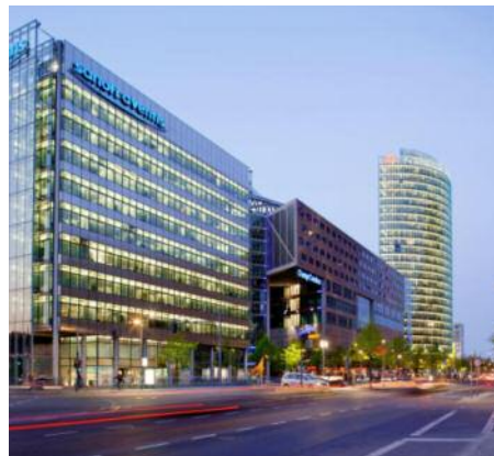
Deutscher Sanofi-Aventis-Sitz in Berlin

Carnival Enterprise jedenfalls schickte Monat für Monat lange Bestelllisten an die Sanofi-Abteilung Public & Market Relations. Sanofi stellte dann die Lkw-Ladungen zusammen, bei denen sich die hauseigenen Medikamente ebenso fan-