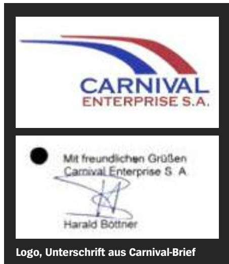
Logo, Unterschrift aus Carnival-Brief