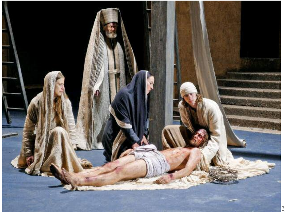
Passionsdarsteller in Oberammergau*: „Keinen Grund, meinen Glauben aufzugeben“

Gottschalk: Aber locker! Dass ich ein wohlhabender Mensch bin, ist mir natürlich trotzdem bewusst. Ich kaufe mir Schuhe, die ich nicht unbedingt brauchte, und ein Auto, das auch nicht sein müsste, vielleicht sogar zwei.