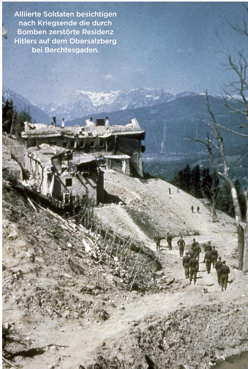
Alliierte Soldaten besichtigen nach Kriegsende die durch Bomben zerstörte Residenz Hitlers auf dem Obersalzberg bei Berchtesgaden.

In der amerikanischen Regierung setzte sich unterdessen die Erkenntnis durch, dass die wachsenden Differenzen mit Stalin es erforderten, über Deutsch-