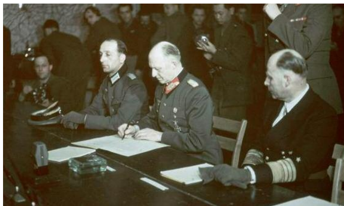
Generaloberst Alfred Jodl unterzeichnet am 7. Mai 1945 in Reims die bedingungslose deutsche Kapitulation.

„Alles ist denkbar“, hatte Hitler im November 1939 gesagt, „eine Kapitulation niemals! Man soll sich das ja aus dem Kopf schlagen!“