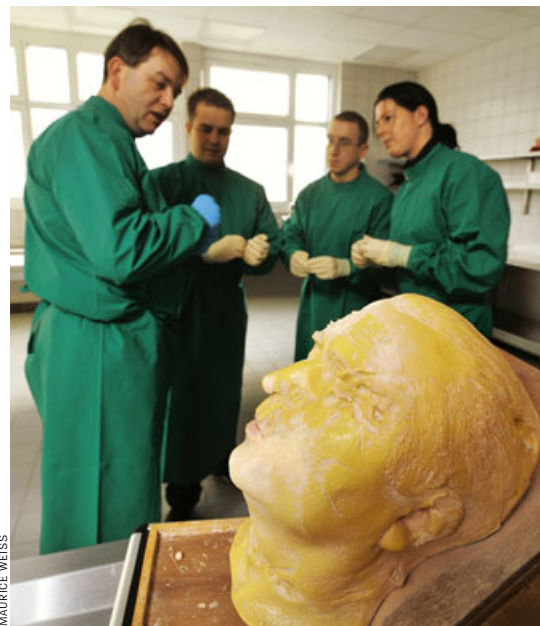
Geschäftsstelle eines Bestattungsunternehmens in Berlin, Ausbildungszentrum für Bestatter in Mümmerstadt: „Ein Traumberuf“

Wer in Berlin über die großen alten Kirchhöfe am Südsterne geht, kann die Vergangenheit begehen, kann die großen Anlagen der Kaufleute und preußischen Größen bewundern, die Grabmale von Konteradmiralen, königlichen Hoflieferanten und kaiserlichen geheimen Bankräten. Sie stehen symbolisch für eine Zeit, in der Menschenleben als mehr oder minder wertvoll galten, in der Bankiers ihrem Rang gemäß große Grabstätten in der ersten Reihe unterhielten und arme Schlucker ganz hinten irgendwo verschwand, mit dem billigsten Holzkreuz über sich.