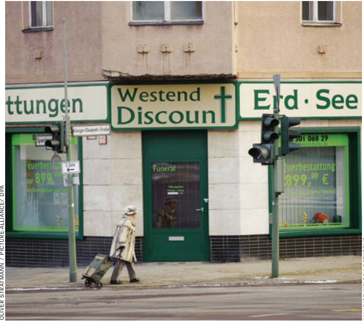
Traditionelle Beerdigung, Bestattungs-Discounter in Berlin: „599 Euro plus Friedhof plus Krematorium“

re, die Türen gehen zu Werkräumen, in denen Sargmuster stehen so groß wie Umzugskisten und in allen Holzqualitäten von Kiefer bis Mahagoni. Es gibt eine Übungskapelle, in der Dekoration, Blumenschmuck und Musik gelehrt werden, es gibt Hygienräume, „aber da können wir gerade nicht hinein“, sagt Frau Eckert. Es liegen gerade Leichen darin, auch das Ankleiden der Toten steht auf dem Lehrplan.