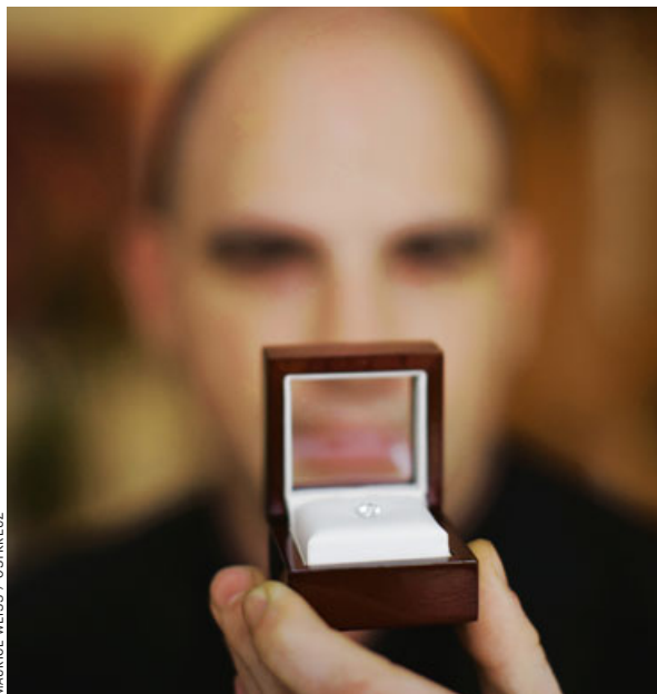
Seebestattung, Diamant aus der Asche eines Verstorbenen, Lager mit Sozialsärgen, Trauerbekundung für Robert Enke: „Muss es denn ein Sarg“