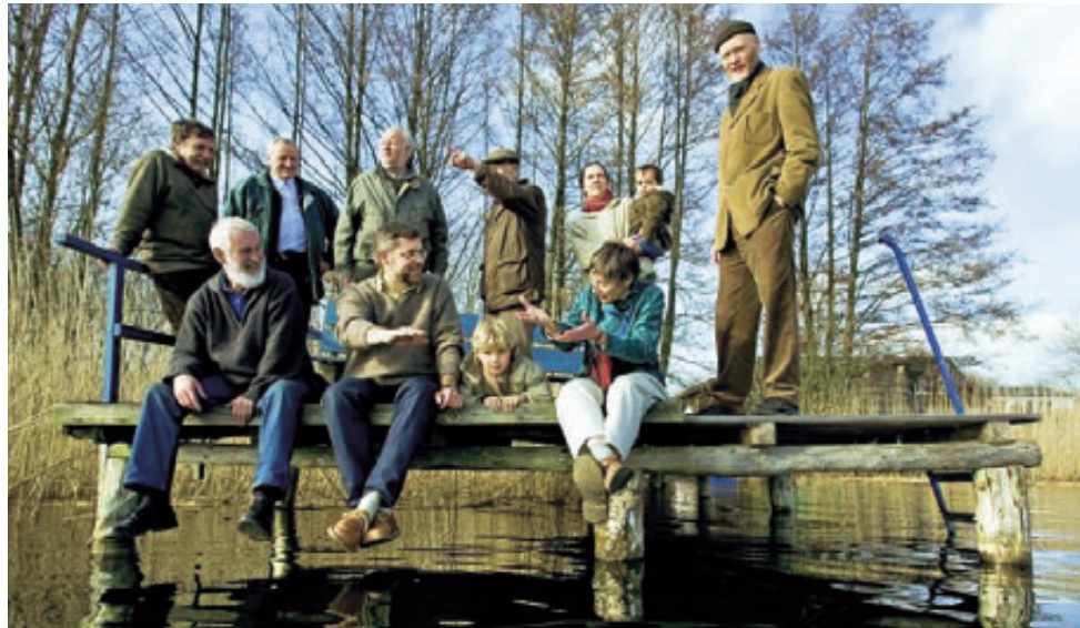
Gruppe „Kontra Industrieschwein“, Muttersau in der Mästerei Sandbeiendorf: Die alte Frage –