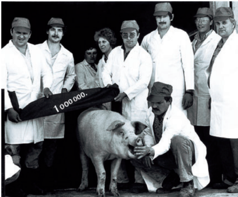
Jubiläumsschwein in Haßleben (Mai 1989): Es roch nicht gut, aber sie waren daran gewöhnt

man warb für Harry und die versprochenen Arbeitsplätze, man debattierte im Ort und ließ im Internet Websites aufeinander los, und es hörte sich an, als ob sie auf vertrackte Weise neu gestellt sei, die alte Frage: Erst das Fressen? Erst die Moral?