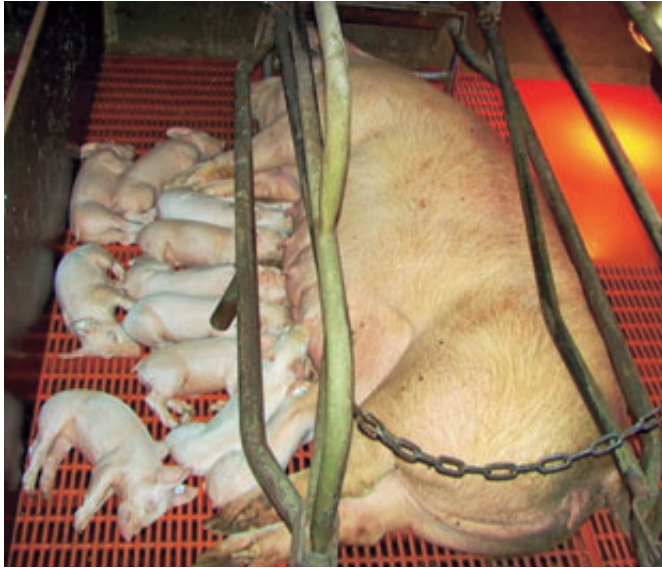
erst das Fressen oder erst die Moral?

les andere ist Spielerei.“ Bisschen kleiner als Haßleben, und Haßleben wird noch moderner. Haßleben, sagt er, das kommt. Das kriegen wir hin.