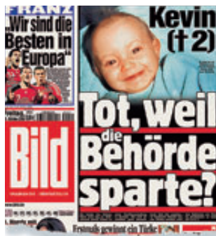
Opfer Kevin Tot im Kühlschrank