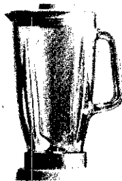
Mixaufsatz: zum Mixen, Mischen, Pürieren und Hacken.

Karin von nebenan knibbelt an ihrer Apfelsine. Das dauert, bis die Schale ab ist. Heidi trinkt einfach ihre Apfelsine. Denn Mutti schneidet die gelbe Kugel durch, hält sie auf die Zitruspresse und schon gibt's ein Glas Saft. Für großen Durst, mit Milch dazu.