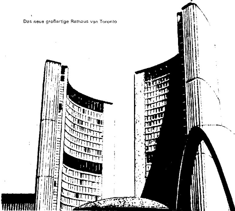
Das neue großartige Rathaus von Toronto