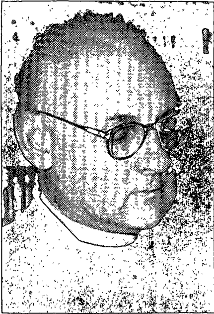
„Opus Dei“-Kritiker von Balthasar Arbeit im Dunkeln...